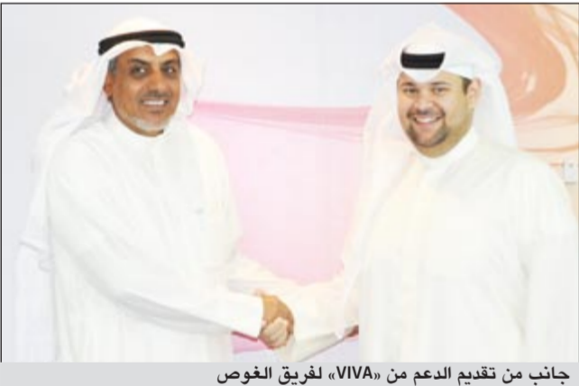
جانب من تقديم الدعم من «VIVA» لفريق الفوص

وأضاف: اننا نفخر بالتعاون مع فريق الفوص الكويتي، لأن أنشطتهم ومشاريعهم تلاقى ترحيباً وتفاعلاً من قبل جميع شرائح المجتمع وقطاعه، أملين أن يكون هناك المزيد من الاهتمام والوعي من جميع فئات المجتمع وليس من الشركات فقط تجاه البيئة التي نعيش فيها، فهي مسألة لا تقتصر على الكويت فقط، ولكنها مسألة استمرارية موارد كوكبنا بأكمله.