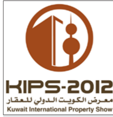
KIPS-2012 معرض الكويت الدولي للعقار Kuwait International Property Show

وأوضح تقرير المنتدى العالمي للتمويل الإسلامي المعد من قبل «بيتك للأبحاث» التطور الكبير الذي يشهده قطاع التمويل الإسلامي فضلاً عن الفرص المتاحة في قطاع التمويل الإسلامي كحلول مستدامة